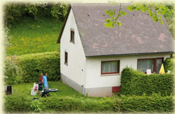
Ferienhaus „Eliese“ ideal für Familien mit Kindern